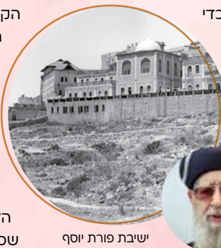
ישיבת פורת יוסף

זו הייתה היה הדבר הכי מדהים בה – היא עשתה הכול בלב שלם. אין ספק שזו מסירות נפש שמוכרת לנו מסיפורים על שנים הרבה יותר רחוקות, אבל סבתא במעשיה הוכיחה לנו שאם יש מטרה נעלית, מסוגלים להכול.